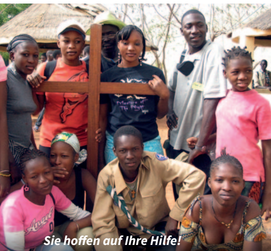
Sie hoffen auf Ihre Hilfe!

Weite Teile Malis stehen unter der Gewalt von Dschihadisten. Zahlreiche christliche Familien flüchten vor dem Terror in die Hauptstadt Bamako, wo auf diese Weise neue Armenviertel entstehen.