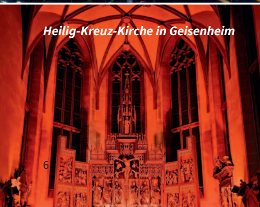
Heilig-Kreuz-Kirche in Geisenheim