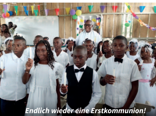
Endlich wieder eine Erstkommunion!