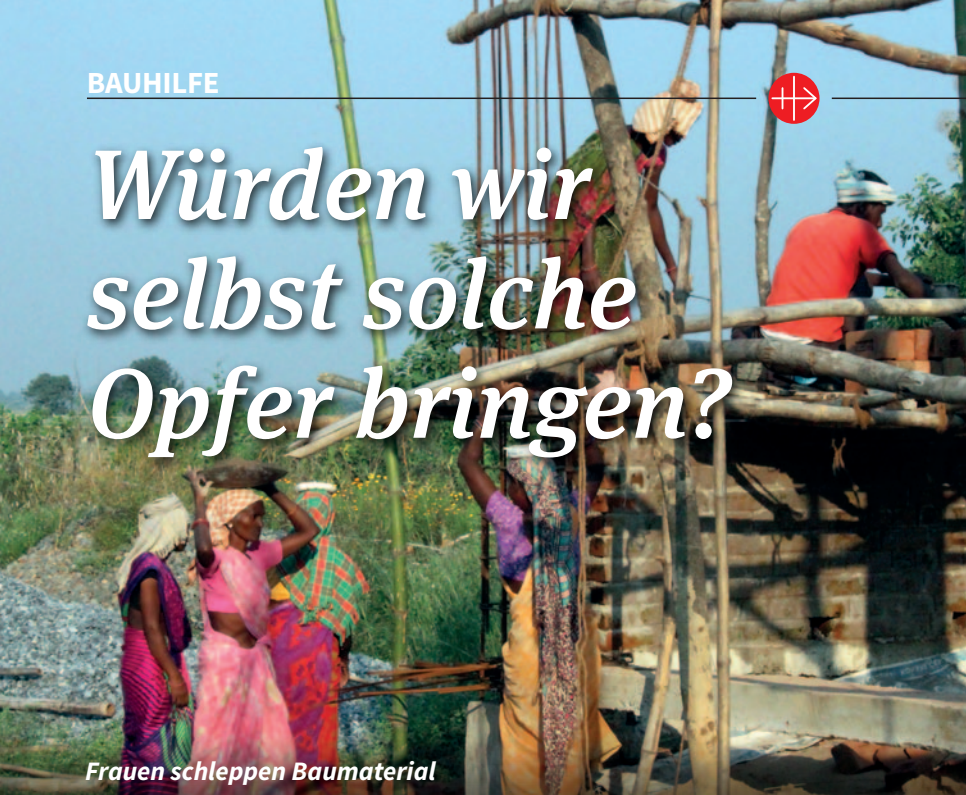
Frauen schleppen Baumaterial