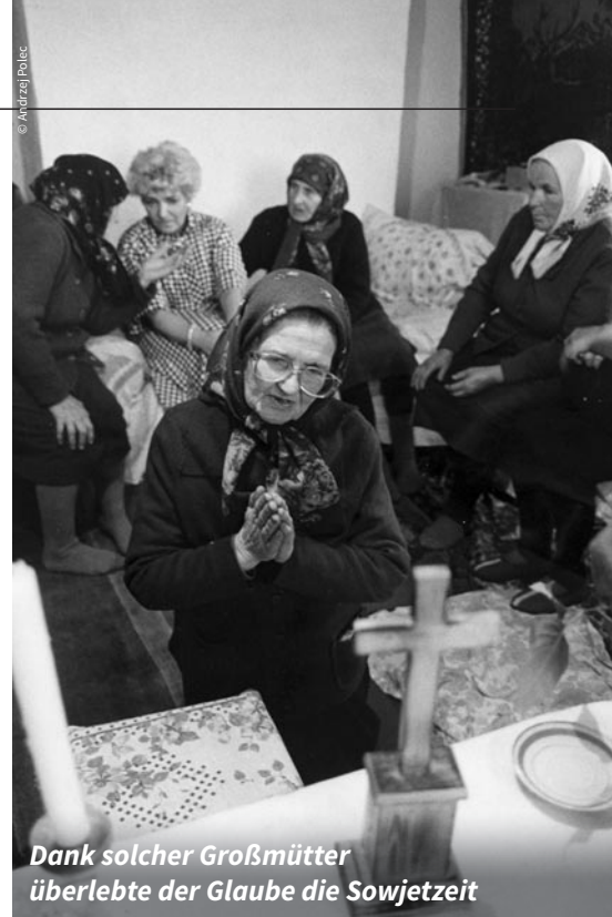
Dank solcher Großmütter überlebte der Glaube die Sowjetzeit

Die Großmütter waren es auch, die in den Zeiten der Verfolgung heimlich auf den Friedhöfen mit anderen Gläubigen beteten, die Kinder taufte und den Tag vorbereiteten, an dem endlich wieder ein Priester kommen würde, um die heilige Messe zu feiern.