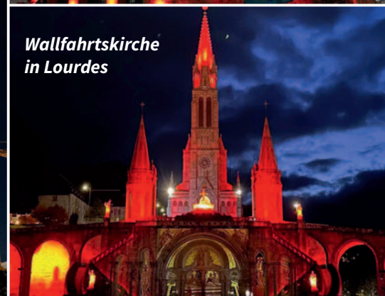
Wallfahrtskirche in Lourdes