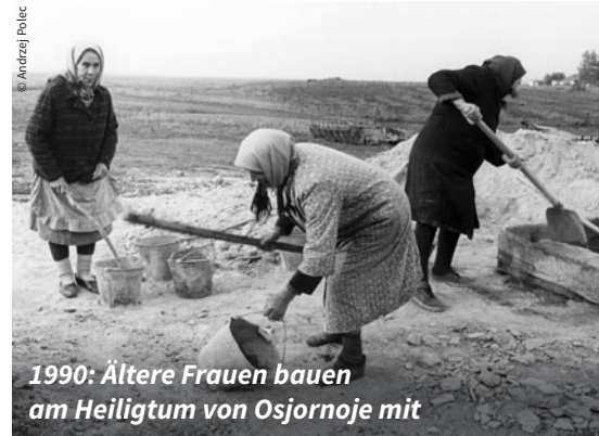
1990: Ältere Frauen bauen am Heiligtum von Osornoje mit

Viele mussten jahrzehntelang darauf warten. Ohne ihr stilles, aber mutiges und treues Zeugnis wäre die Flamme des Glaubens in finsterner Zeit erloschen. Sie möchten wir an dieser Stelle besonders würdigen.