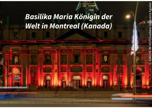
Basilika Maria Königin der Welt in Montreal (Kanada)