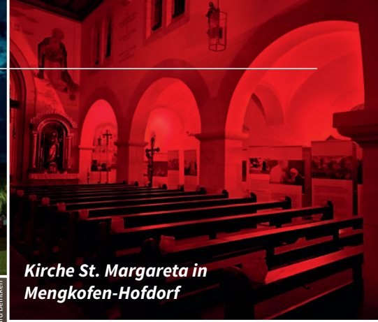
Kirche St. Margareta in Mengkofen-Hofdorf