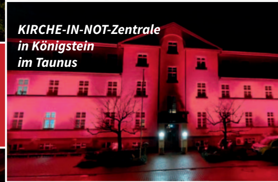
KIRCHE-IN-NOT-Zentrale in Königstein im Taunus

Rund um den 20. November 2024 sind anlässlich des RED WEDNESDAY weltweit mehr als 1000 Kirchen, Denkmäler und öffentliche Gebäude in über 20 Ländern rot angestrahlt worden. Zudem gab es an zahlreichen Orten Gebetswachen, Gottesdienste und Vorträge. Sehen Sie hier eine kleine Auswahl aus Deutschland und der Welt.