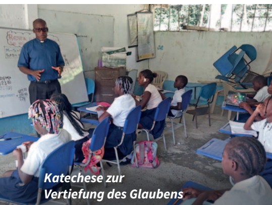
Katechese zur Vertiefung des Glaubens

Zugleich möchten wir aber auch dazu beitragen, dass Pfarrgemeinden – besonders in schwierigen Regionen – nicht so lange ohne Priester bleiben. Denn das Beispiel von Noanamito zeigt, wie wichtig Priester sind. Deshalb unterstützen wir regelmäßig die Priesterausbildung in mehreren Seminaren Kolumbiens, damit sich die Gläubigen nicht „von der Kirche vergessen“ fühlen.