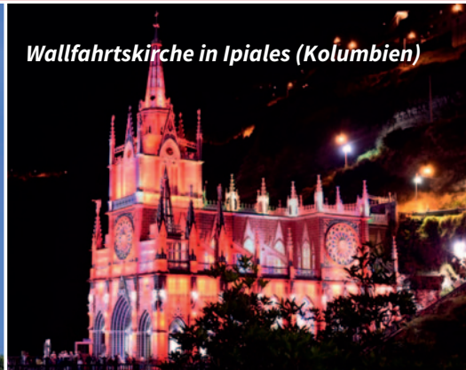
Wallfahrtskirche in Ipiales (Kolumbien)