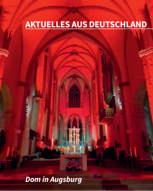
Dom in Augsburg