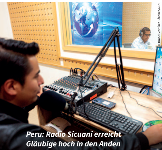
Peru: Radio Sicuani erreicht Gläubige hoch in den Anden

Dank Ihrer Hilfe erreicht die Frohe Botschaft unzählige Menschen in aller Welt in ihren Häusern, in Kliniken, Gefängnissen und abgelegenen Gebieten. So kann Gott – oft unerwartet – ihre Herzen berühren. Unterstützen Sie dieses Apostolat auch weiterhin?