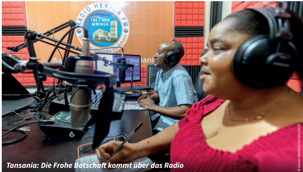
Tansania: Die Frohe Botschaft kommt über das Radio

Insbesondere während der Covid-19-Pandemie machten viele Menschen die Erfahrung, dass die Kirche durch Fernsehen, Radio oder Internet gewissermaßen zu ihnen nach Hause kam. Aber auch in „normalen“ Zeiten haben viele von uns schon einmal an einem verregneten Tag, in einer schlaflosen Nacht oder in Zeiten der Krankheit eine Sendung eingeschaltet und fanden auf einmal Trost, Antworten und wertvolle Impulse für den Glauben. Sogar Menschen, die sonst nie Kontakt zur Kirche haben, kommen auf diese Weise wie „zufällig“ mit Gott in Berührung. Immer wieder hört man Aussagen wie: „Ich war deprimiert und verzweifelt, und dann habe ich im Internet dieses Video