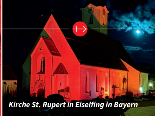
Kirche St. Rupert in Eiselfing in Bayern