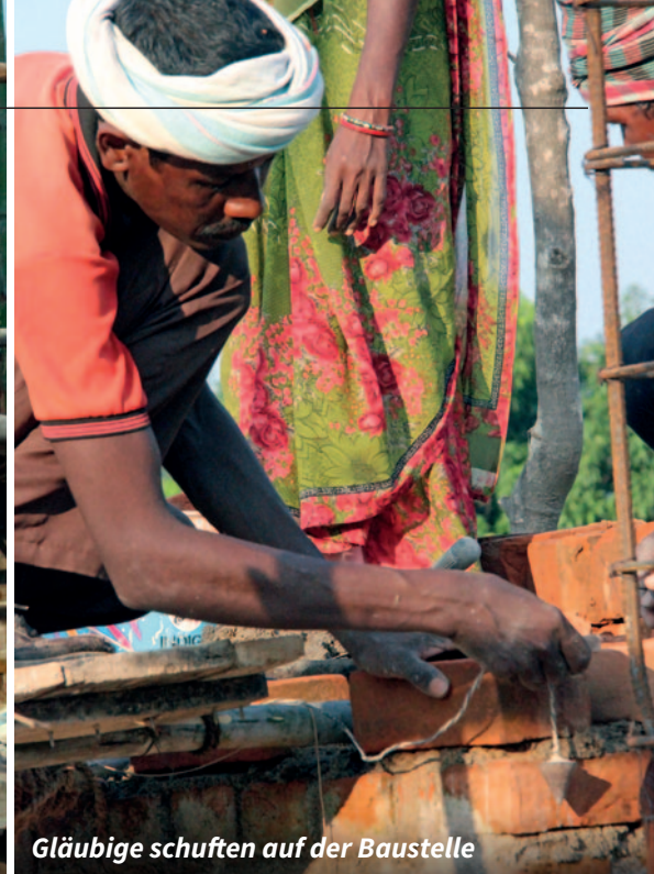
Gläubige schuften auf der Baustelle

Bitterarm sind die Einwohner der mitten im Dschungel gelegenen Pfarrei Gudrapara im ostindischen Bundesstaat Odisha. Aber aus Liebe zur Kirche bringen sie erstaunliche Opfer.