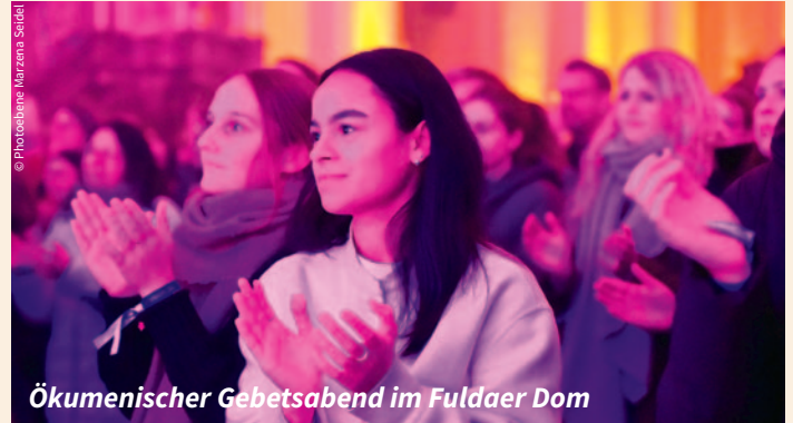
Ökumenischer Gebetsabend im Fuldaer Dom