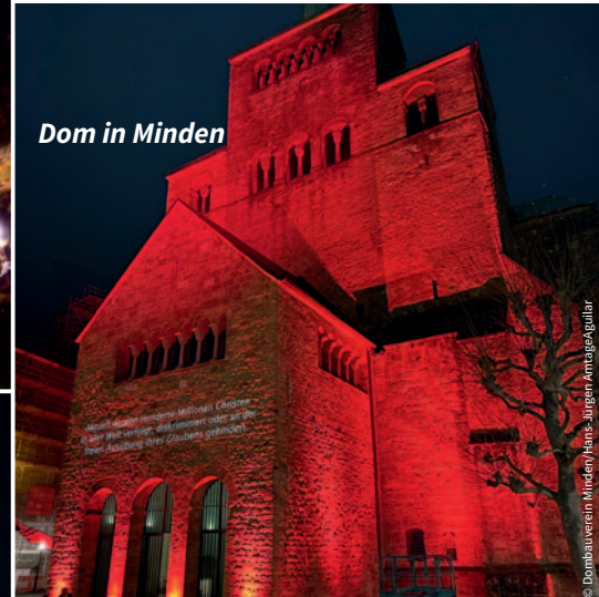
Dom in Minden