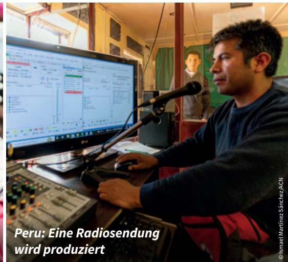
Peru: Eine Radiosendung wird produziert

geschaut“ oder „Eigentlich hatte ich zu nichts Lust, zappte mich durch das Programm, und plötzlich war da dieser Priester, der von Jesus Christus sprach. So etwas hatte ich noch nie gehört.“