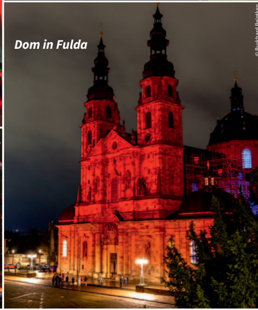
Dom in Fulda