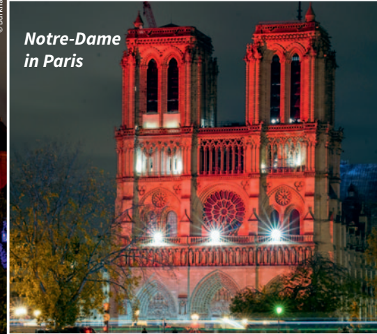
Notre-Dame in Paris

Rund um den 20. November 2024 sind anlässlich des RED WEDNESDAY weltweit mehr als 1000 Kirchen, Denkmäler und öffentliche Gebäude in über 20 Ländern rot angestrahlt worden. Zudem gab es an zahlreichen Orten Gebetswachen, Gottesdienste und Vorträge. Sehen Sie hier eine kleine Auswahl aus Deutschland und der Welt.