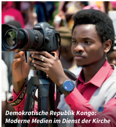
Demokratische Republik Kongo: Moderne Medien im Dienst der Kirche