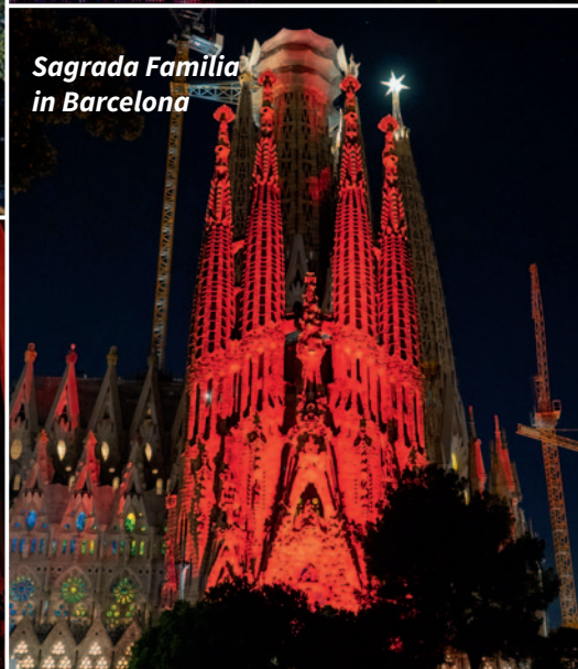
Sagrada Familia in Barcelona