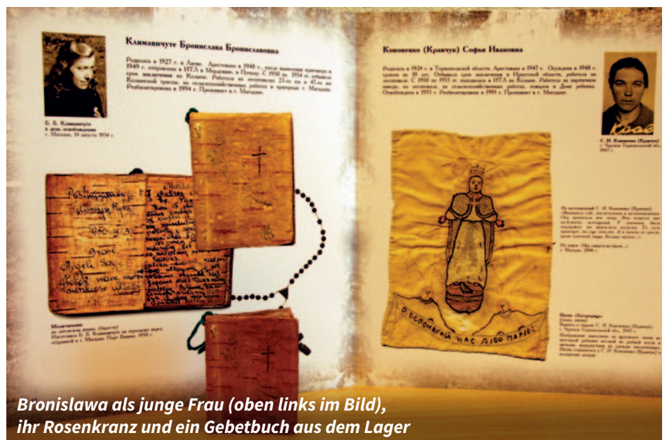
Bronislawa als junge Frau (oben links im Bild), ihr Rosenkranz und ein Gebetbuch aus dem Lager